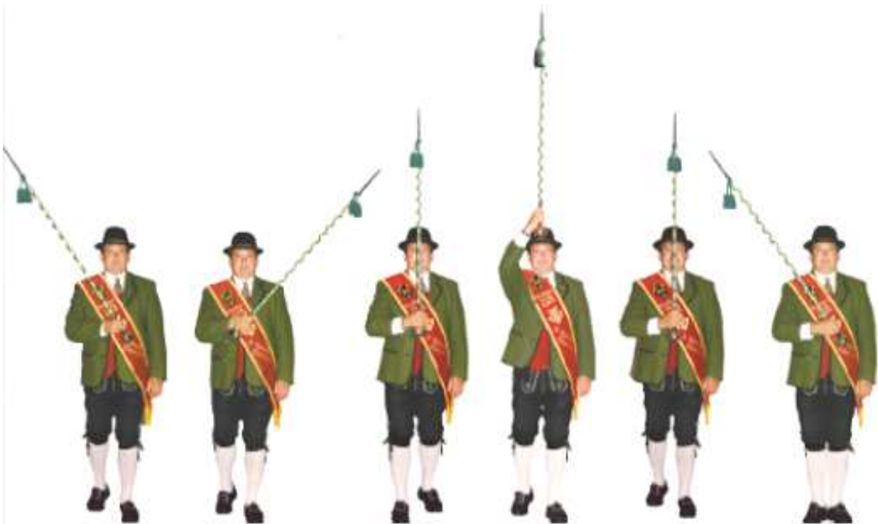
Abb. 46 Takt 1