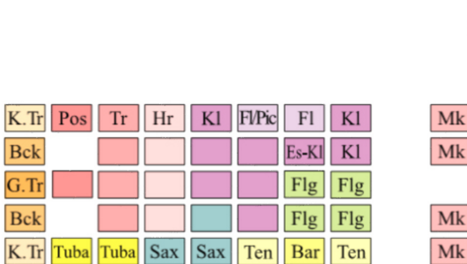
Grafik 11: Halten mit Kommando

Im Bedarfsfalle kann das Kommando zum Halten der Musikkapelle auch nach einer Kehrtwendung des Stabführers (über links) erfolgen. Vor dieser Kehrtwendung ist erforderlich, dass der Stabführer durch einige zusätzliche Schritte den Abstand zur Musikkapelle vergrößert.